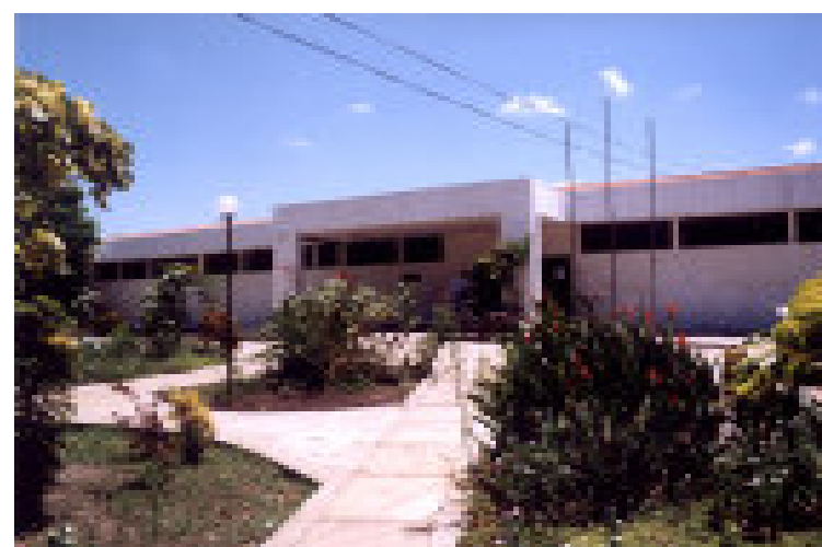
Excelência no atendimento materno-infantil

O hospital também oferece, desde o mês de fevereiro deste ano, o “Teste do Pezinho”, sendo Pedro II o segundo município localizado na região Norte do Estado que conta com esse serviço, o primeiro município da região a disponibilizar esse exame foi Parnaíba. A gestante ainda tem um acompanhamento completo, que não se restringe à parte de exames necessários no pré-natal, mas também diz respeito ao acesso a medicamentos, tratamento odontológico e a uma dieta nutricional. Após o nascimento da criança, o hospital continua encaminhando as mães para grupos de apoio ao aleitamento materno na comunidade ou em serviços de saúde.