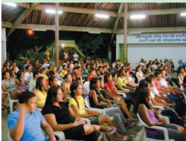
ProJovem Trabalhador substitui Juventude Cidadã

E m 2008 foram mais de 13 mil qualificações profissionais para os jovens piauienses. Para 2009, há recursos assegurados para outras 30 mil qualificações profissionais e sociais dentro do nosso Estado, de acordo com a Secretaria Estadual do Trabalho e Empreendedorismo.