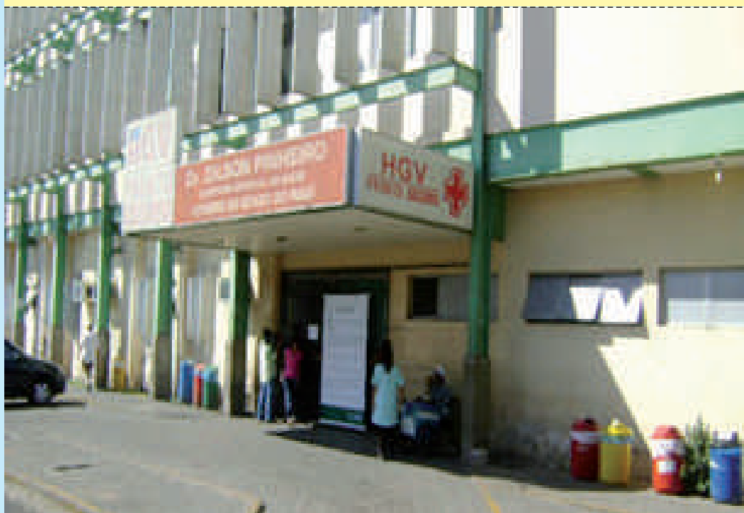
Hospital Getúlio Vargas

ponta estão sendo adquiridos para reestruturar setores como as UTIs, Ambulatório de Fisioterapia, Lavanderia, Almoxarifado, Farmácia, Nefrologia, Centro Cirúrgico, Central de Material e Esterilização.