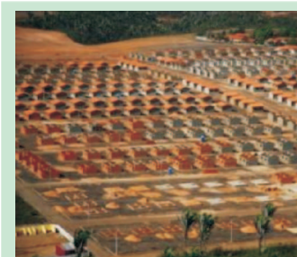
Obras de habitação