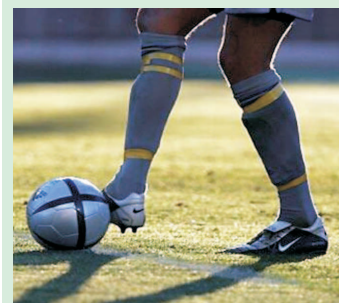
Programa Esporte Antares

Ainda no mês de outubro, o Governo do Estado, em convênio com a Companhia de Desenvolvimento dos Vales dos Rios São Francisco e Parnaíba (Codevasf), vai entregar 90 hectares de áreas irrigadas no município de Colônia do Gurguéia, com a utilização de água de poços tubulares. O projeto vai beneficiar a produção local favorecendo o cultivo das plantações tradicionais da região.