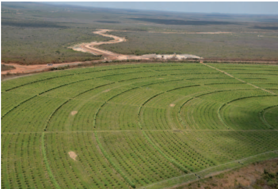
Tabuleiros litorâneos

As frutas orgânicas produzidas no projeto de irrigação Tabuleiros Litorâneos, no município de Parnaíba, a 330 quilômetros de Teresina, serão comercializadas em todo o Brasil pelo grupo Walmart. Os entendimentos entre a Cooperativa dos Produtores Orgânicos dos Tabuleiros Litorâneos (BioFruta) e o Clube dos Produtores Walmart já estão em andamento.