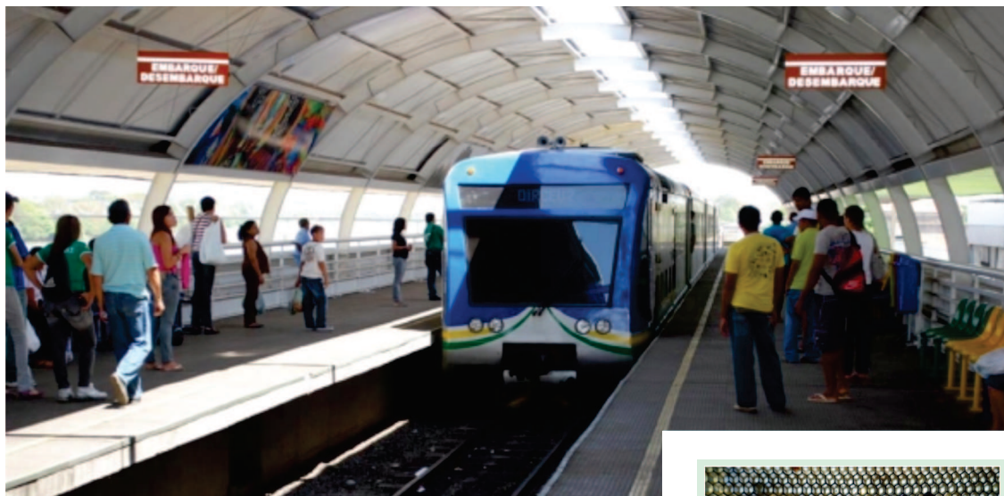
Metrô de Teresina

“O tempo de espera vai diminuir de 40 para 15 minutos. Vale ressaltar também que a nossa estimativa é de que o transporte passa a contemplar pelo menos 50 mil pessoas por dia”, enumera. As estações serão construídas nas seguintes áreas: Mafuá, Piçarra, Cristo Rei, Tancredo Neves, São João e Rodoviária.