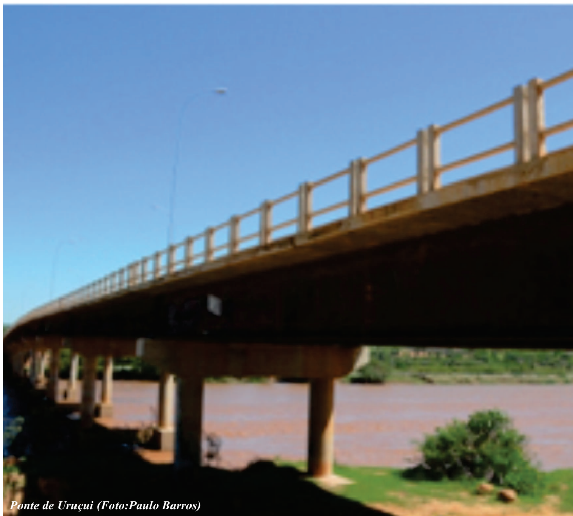
Ponte de Uruçuí

O governo também construiu o anel viário de Uruçuí, retirando o tráfego pesado das ruas centrais da cidade. Na construção dos três quilômetros de pista, foram investidos R$ 1,4 milhão, recursos do Tesouro Estadual.