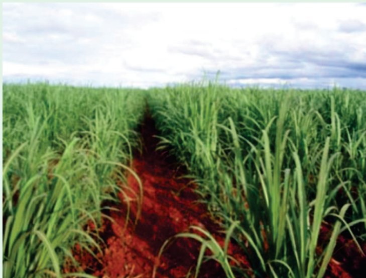
Plantação de cana-de-açúcar

Pelo levantamento, a produção piauiense chegará a 982,9 mil toneladas, contra 836,9 mil da safra passada. O aumento vai ocorrer por