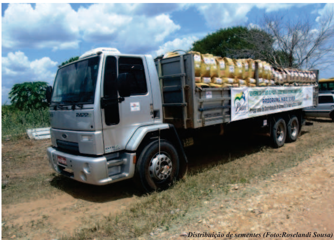
— Distribuição de sementes