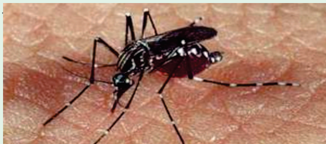
Mosquito da dengue ( aedes aegypti )

As novas estratégias de enfrentamento da dengue aplicadas, este ano, no Território Serra da Capivara apresentaram resultados positivos ainda no primeiro trimestre. Denominadas ações intersetoriais, inter e intra-institucionais de co-responsabilidades, os trabalhos de combate ao vetor ficaram por conta de cada instituição ou setor, que desenvolve sua própria atividade.