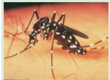
Controle da dengue

A sessão solene desta quinta-feira (22), na Assembléia Legislativa, destaca os aspectos hidroambientais do rio e sua importância. Mas a programação prossegue até o próximo sábado (24), quando acontecerá uma Blitz Ambiental - Rio Parnaíba, a partir das 8h, com concentração na Praça da Costa e Silva. O evento tem a parceria importante da Secretaria Municipal do Meio Ambiente (Semam). No dia 23 de março, a Agespisa estará realizando em parceria com o Centro de Educação da Semar, a Gincana Ambiental, a partir das 8h, no Encontro dos Rios.