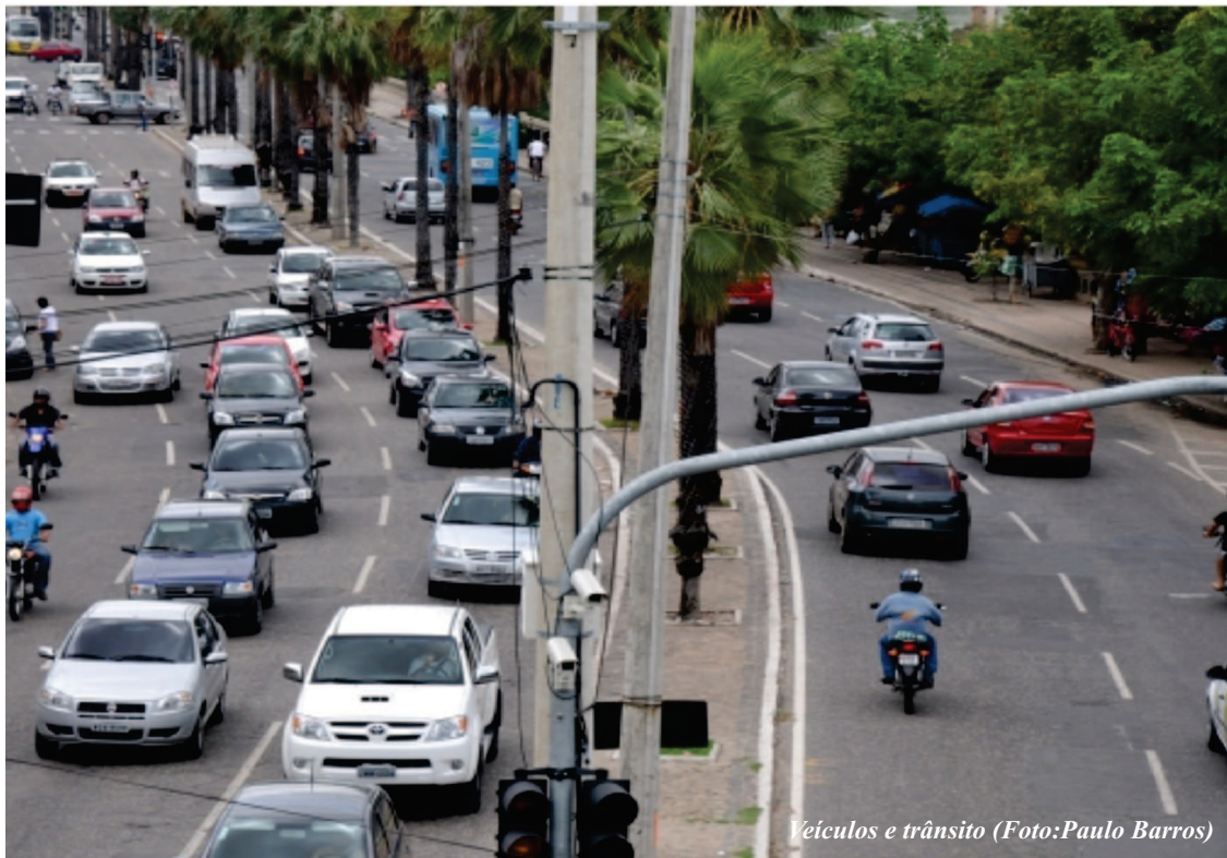
Veículos e trânsito

Durante o mês de março, a Companhia Independente de Trânsito (Ciptran) registrou 1.222 infrações gravíssimas na capital, de um total de 1.608, o que corresponde a 75% do total. Destas, 463 são referentes ao não uso do capacete pelos motociclistas, seguida por 415 ocorrências relativas ao condutor não devidamente habilitado. A terceira infração mais cometida soma 236 notificações e faz alusão ao veículo não registrado ou não licenciado.