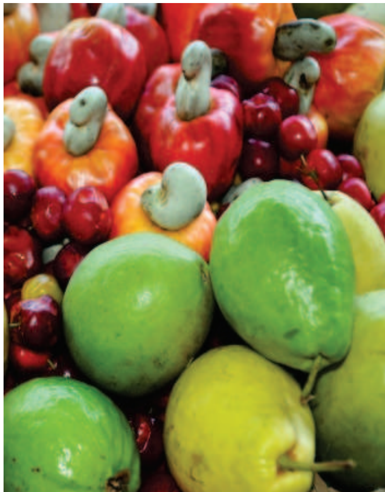
Frutas da estação