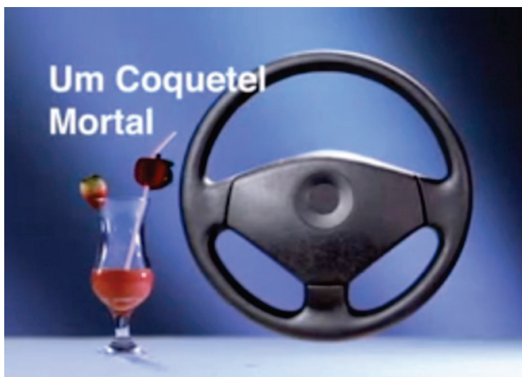
Campanha contra os acidentes de trânsito provocados pelo consumo de álcool

O Governo do Estado do Piauí, através do Departamento Estadual de Trânsito (Detran-PI), lançou uma campanha pela educação no trânsito contra o uso excessivo de álcool ao volante.