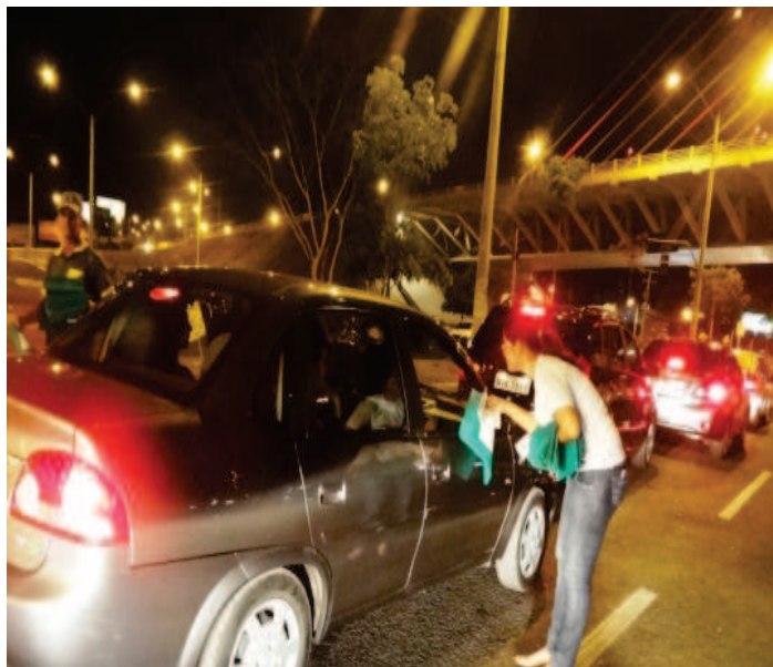
Blitzen educativas da Semana de Trânsito

A Coordenadoria Estadual da Juventude (Cojув) participou, na noite dessa terça-feira (25), da solenidade de encerramento da Semana Nacional do Trânsito, no Complexo Ponte Estaiada, em Teresina, marcada com a realização de blitz educativa, exposições e peças teatrais.