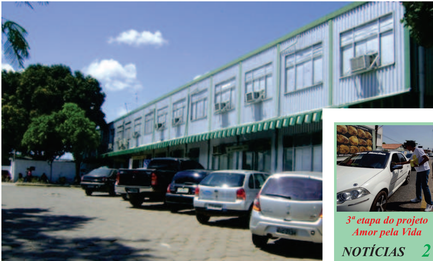
Maternidade Dona Evangelina Rosa

Cerca de 40 bebês devem fazer o exame na maternidade diariamente. Thamirys Viana