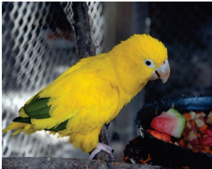
Ararajuba: zoobotânico acolhe ave ameaçada

Um casal de Ararajuba é a nova atração do Parque Zoobotânico de Teresina. As aves, que correm grande risco de extinção, foram abandonadas no local por uma pessoa não identificada e estão passando por um processo de readaptação, principalmente, alimentar.