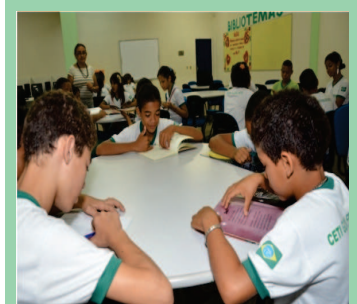
Duas técnicas do FNDE chegam a Teresina