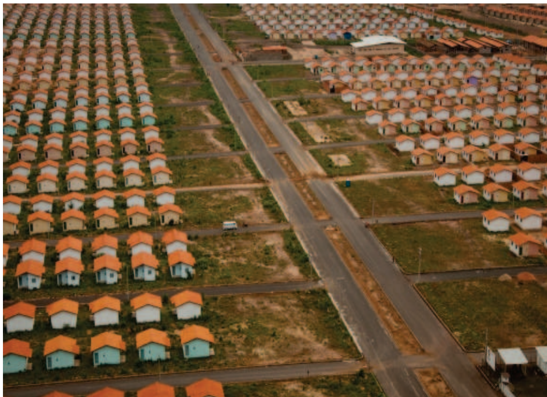
Asfaltamento do Residencial Jacinta Andrade