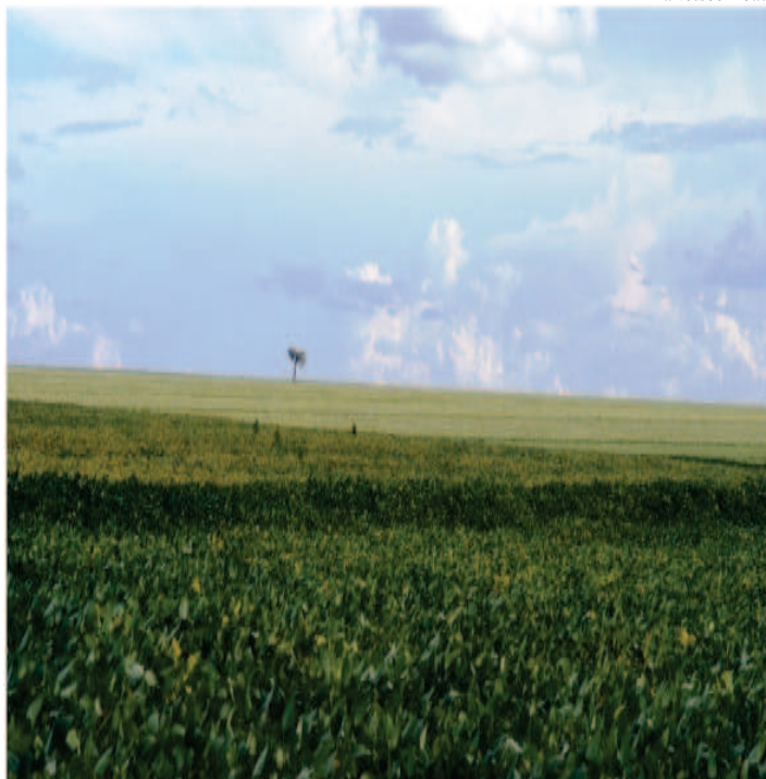
Soja nos cerrados: produção vai crescer

O terceiro levantamento da safra brasileira de grãos, o último de 2012, realizado pela Companhia Nacional de Abastecimento (Conab) já coloca a produção de soja do Piauí 17% acima da safra passada. A estimativa é de que sejam colhidas no próximo ano 1.477,3 milhão de toneladas, 214,2 mil toneladas a mais do que a registrada em 2011.