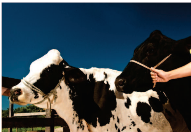
Prevenção à febre aftosa

O procedimento de constatação faz parte de uma série de ações desenvolvidas pelo Governo do Estado. A expectativa é que o Piauí seja classificado nacionalmente pelo Mapa como Zona Livre de Febre Aftosa, o que está previsto para acontecer até abril deste ano. Em todo o território piauiense está sendo realizada a vacinação dos rebanhos e, entre 1º e 15 de fevereiro, os criadores terão que realizar a certificação dos animais.