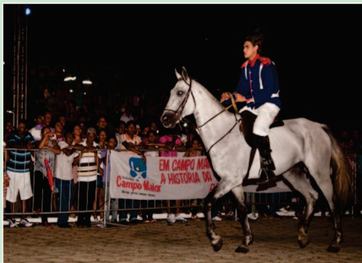
Encenação Batalha do Jenipapo