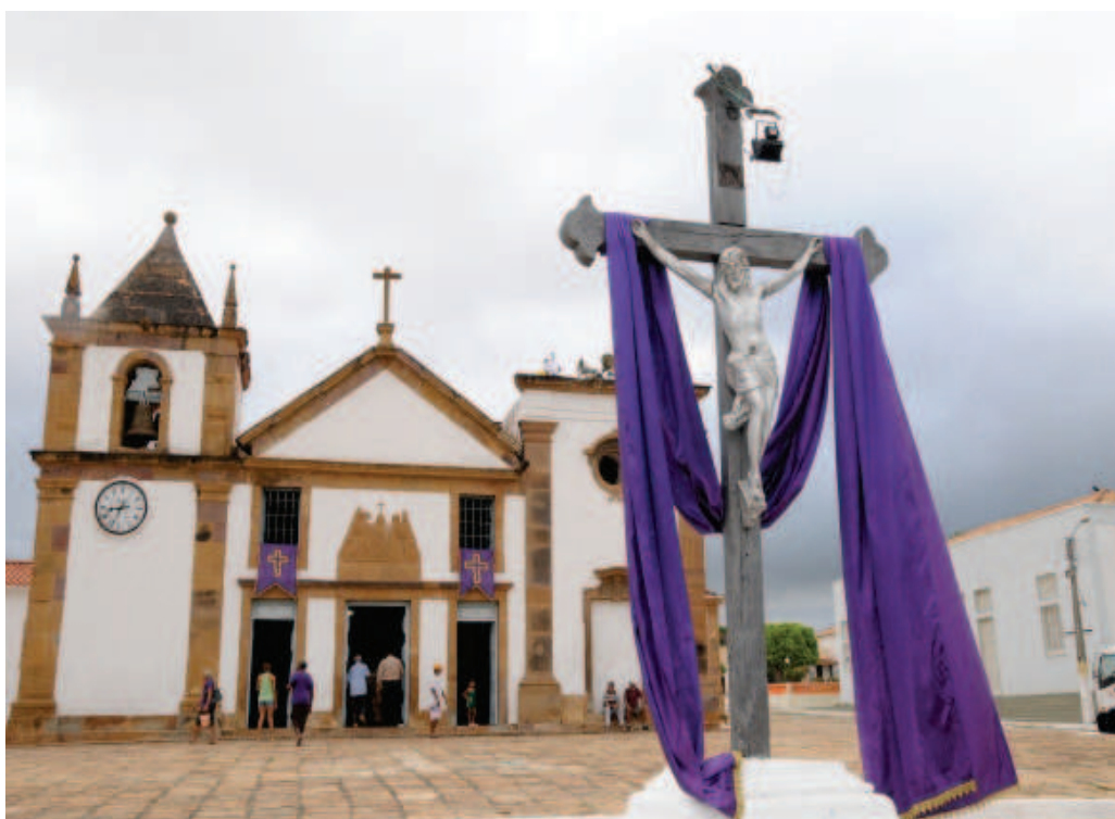
Igreja preparada para semana santa

Na sexta-feira, um dia após o Fogaréu, acontece a procissão do Senhor Morto, outra manifestação que reúne grande número de fiéis.