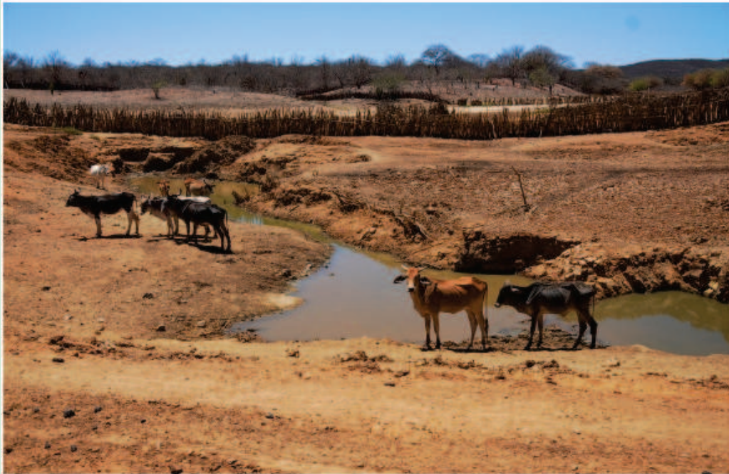
Piauí perdeu 61 mil animais com a estiagem