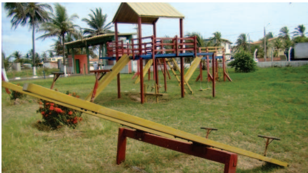
Espaço Lazer do Servidor Estadual