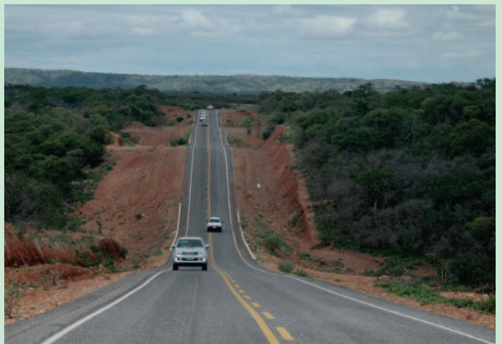
Governo garante rodovias de qualidade

O último lote, o quarto, envolve as rodovias PI 466, PI 249, PI 241 e PI 242, nos seguintes trechos: Entroncamento BR 020/João Costa, com 14,62 Km; Marcolândia/Caldeirão Grande, com 13 Km; Entroncamento PI 143/Santo Inácio do Piauí, com 25 Km; e Santa Cruz/Wall Ferraz, com 14 Km.