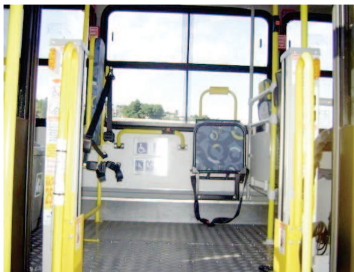
Ainda em 2011, empresas foram autuadas e multadas por descumprirem prazo de adequações

deficiência dentro dos ônibus são: plataforma de elevação, barras de identificação com sinalização para deficientes audiovisuais, bancos preferenciais, cadeira de transbordo, cinto de segurança, vão livre, pega mão, cestos de lixo, apoios de braço e iluminação dos degraus, entre outros. “Estes itens regulamentados pelo Inmetro visam melhorar a qualidade de vida das pessoas com deficiência ou mobilidade reduzida, seja ela definitiva ou temporária”, explica a supervisora.