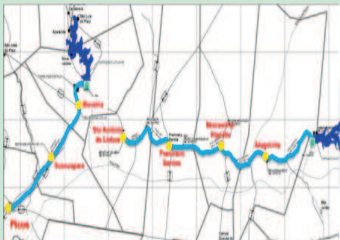
Mapa mostra por onde irá passar a adutora Bocaina/Piauí II

O projeto prevê que a adutora de Bocaina/Piauí II será a mais importante obra hídrica do Governo do Piauí no combate à seca na região do Semiárido. Cerca de 120 mil moradores desses municípios devem ser beneficiados. A obra será executada com recursos da ordem de R$91,5 milhões, oriundos do Ministério da Integração Nacional, através do Programa de Aceleração do Crescimento para regiões afetadas pela seca no Semiárido, o PAC Seca.