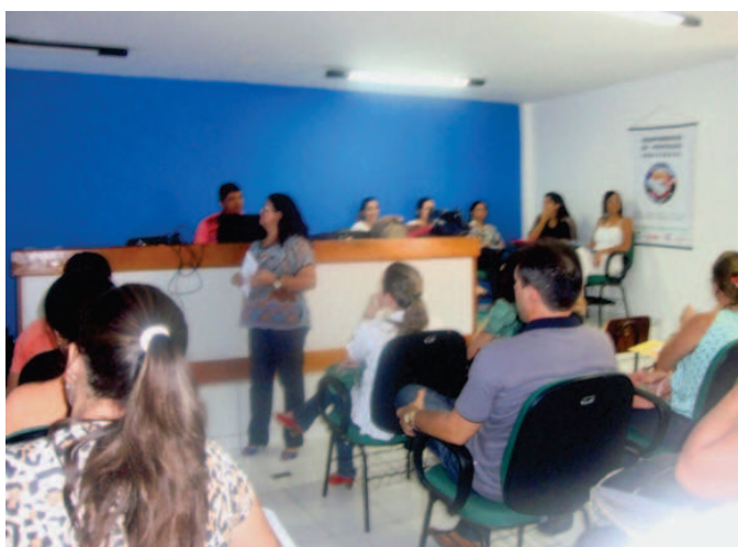
Pactuação Planície Litorânea

O Estado do Piauí está em fase de organização e estudo da regionalização e socialização junto aos municípios para conscientizar quais as responsabilidades que cada um deverá cumprir com relação às ações e serviços de saúde, conforme o Decreto 7.508. Esse documento regulamenta a Lei nº 8.080, de 19 de setembro de 1990, que dispõe sobre a organização