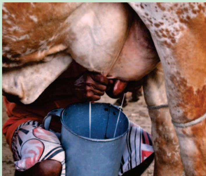
Produção de leite

O Governo do Estado autorizou, nesta terça-feira (28), capitalização da Agência de Fomento do Estado do Piauí em R$ 1.250 milhão para estímulo à atividade de pequenos e médios agropecuaristas através da linha de crédito Piauí Fomento Leite, que integra o do Programa Balde Cheio, da Secretaria do Desenvolvimento Rural (SDR).