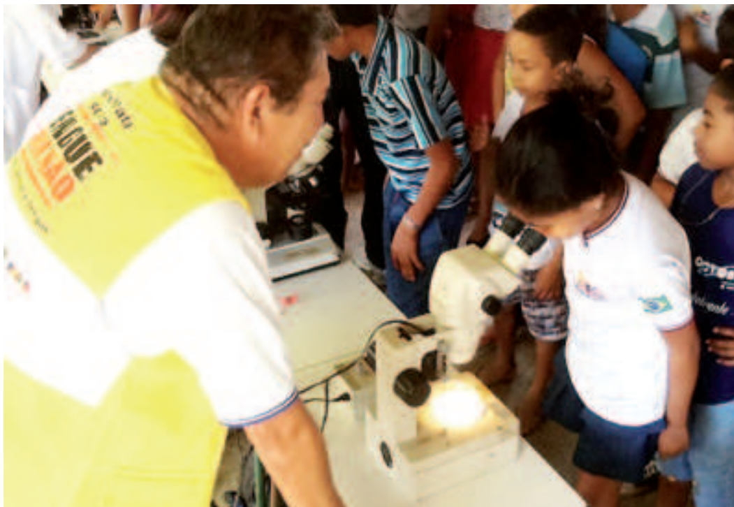
Projeto Saúde Itinerante em Miguel Leão