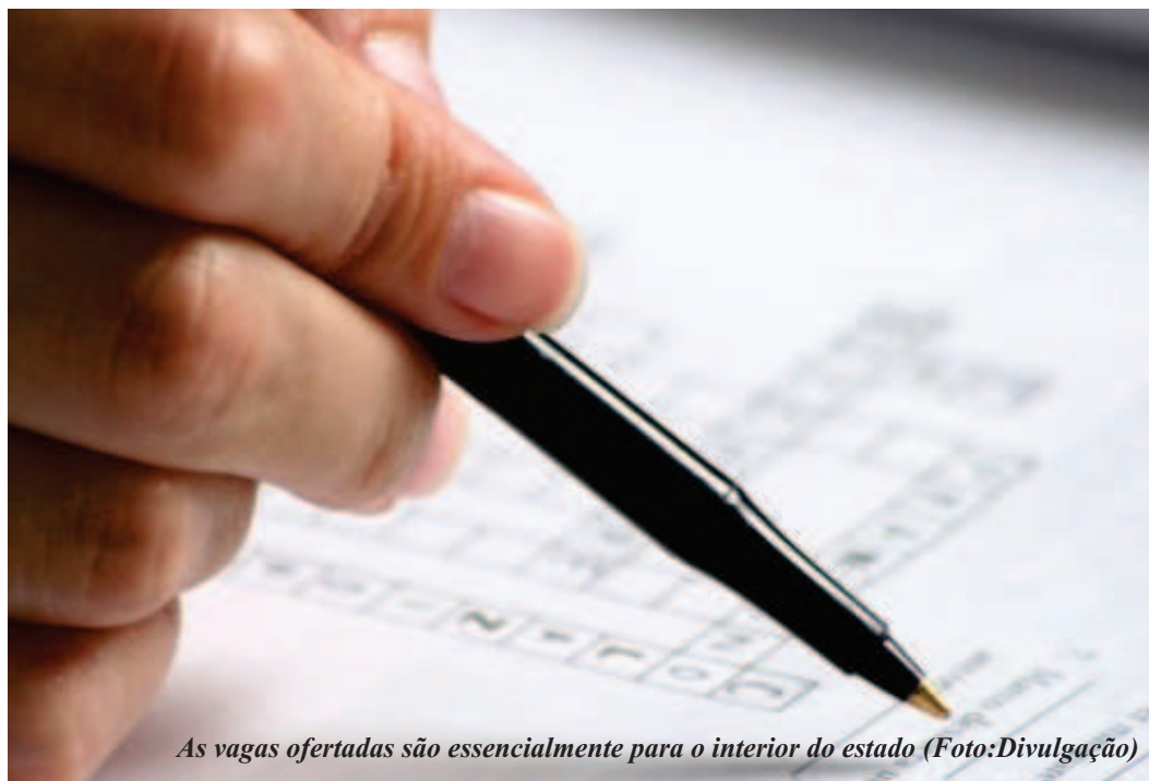
As vagas ofertadas são essencialmente para o interior do estado

Já está disponível na página do Núcleo de Concursos e Promoção de Eventos (Nucepe), o edital do concurso público para o provimento de 430 vagas na Polícia Militar do Piauí. Os cargos disponíveis são para soldado e oficial da corporação, cujas remunerações iniciais são de R$ 2.047,63 e R$ 3.897,04, respectivamente.