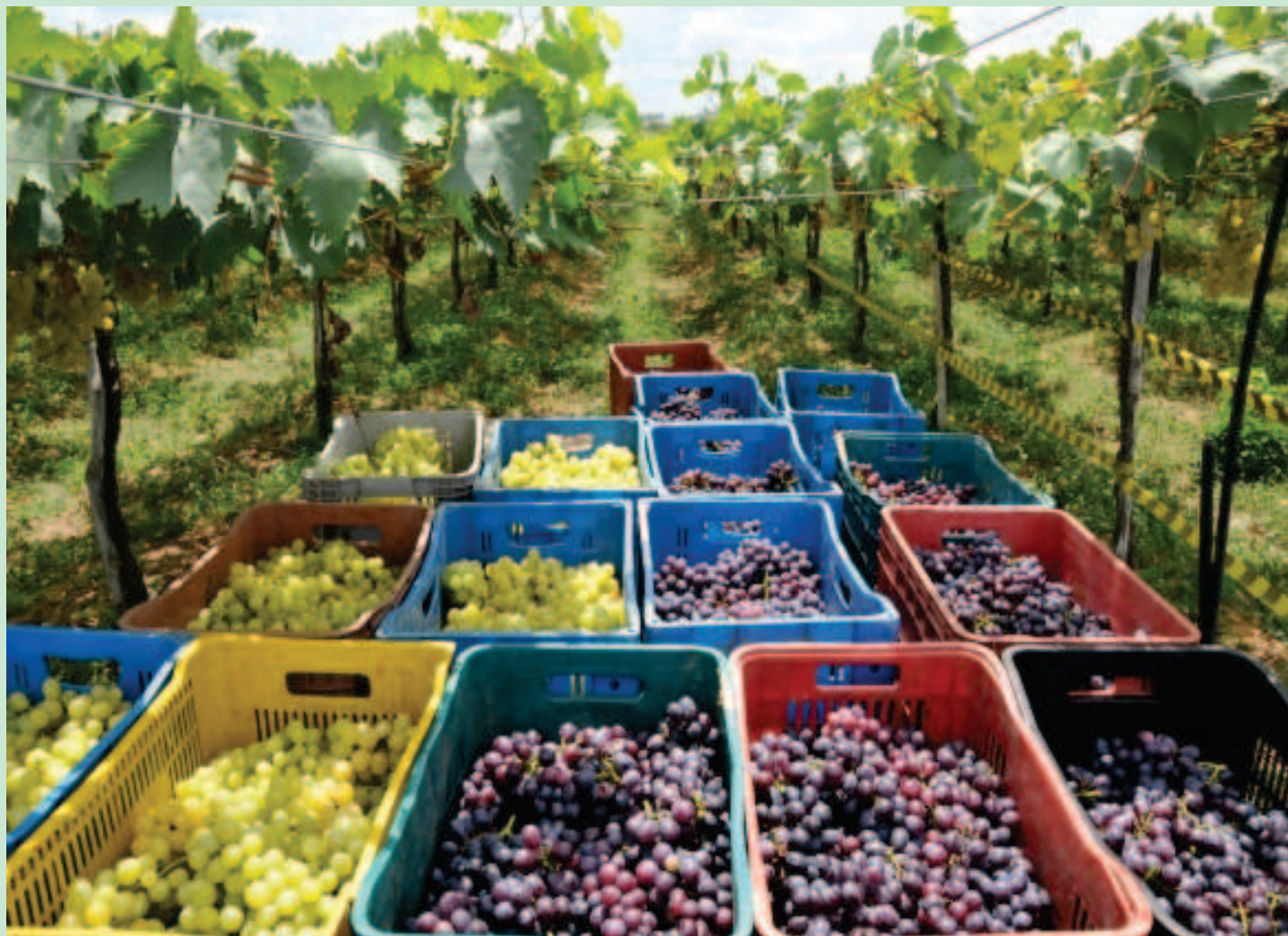
Produção de uvas em São João do Piauí

O lançamento oficial do IV Festival da Uva vai acontecer no próximo dia 22, no Palácio de Karnak, em Teresina, e no dia 25, em São João do Piauí. O evento será realizado no período de 14 a 16 de novembro, em São João do Piauí.