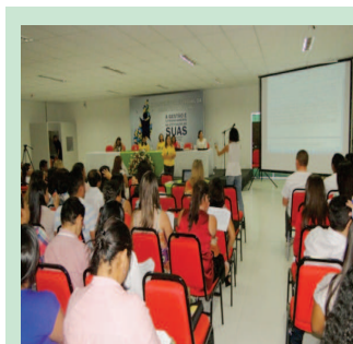
Os Eixos levados à apreciação dos profissionais da assistência social