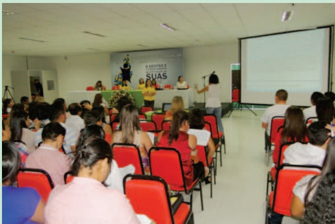
X Conferência Estadual da Assistência Social: grupos de discussão

A diretora da Unidade de Gestão do Sistema Único da Assistência Social da Sasc, fala da relevância que é levar para a discussão todos os Eixos Temáticos, que constam na programação da Conferência. “A apreciação dos Eixos Temáticos, por parte dos profissionais da Assistência Social que se encontram neste evento, é uma orientação do Conselho Nacional da Assistência Social que, entre outros pontos, foi quem definiu o tema central da nossa décima conferência. O que sairá desta discussão sobre os eixos serão as deliberações dos 224 municípios do Estado do Piauí, que terão suas propostas apresentadas por seus respectivos delegados na Conferência Nacional da Assistência Social”, explica.