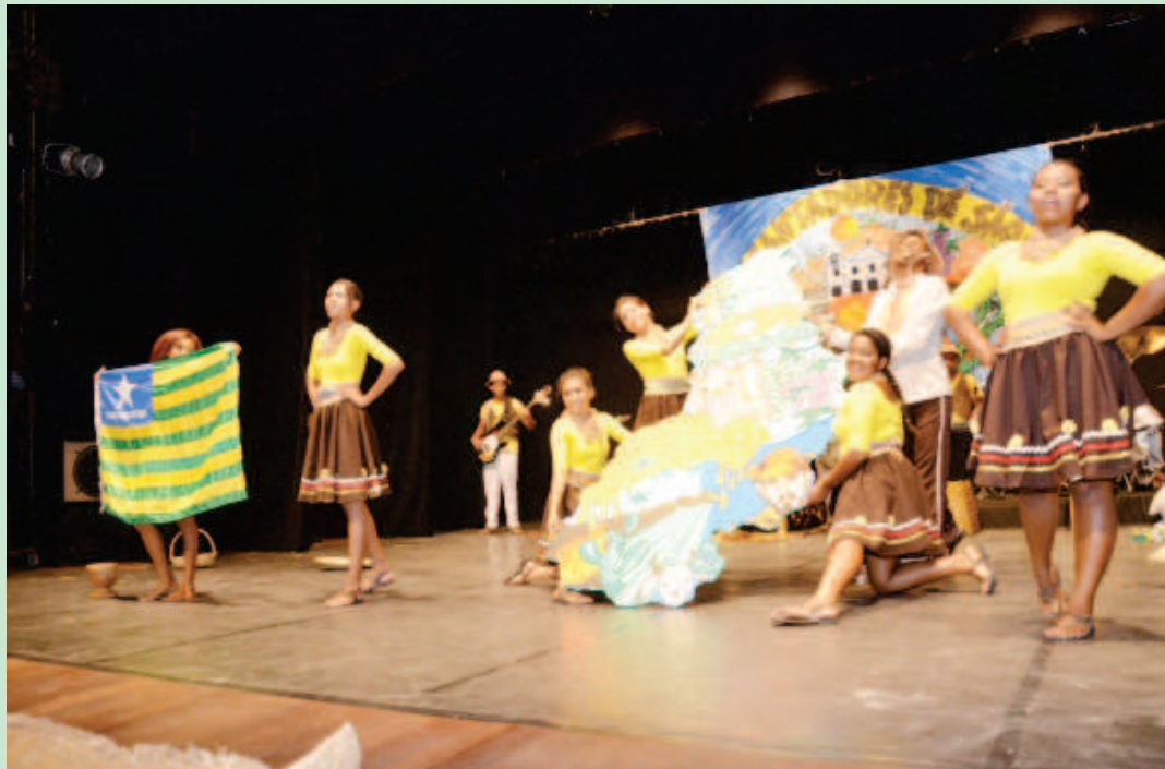
Grupo Estrelas da Paz canta Jenipapo

Participaram do evento, estudantes da Educação Básica, divididos nas 21 Gerências Regionais de Educação (GRE). O Festival é uma ação que oportuniza aos estudantes da rede pública estadual da Educação Básica (Ensino Fundamental a partir do 8º ano, Ensino Médio, EJA, Educação Profissional Técnica de Nível Médio) expressarem seus talentos através de