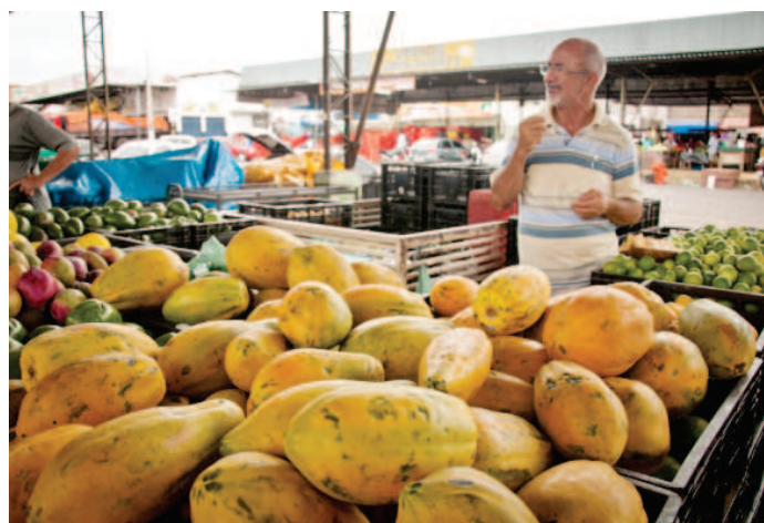
Cuidado com alimentos