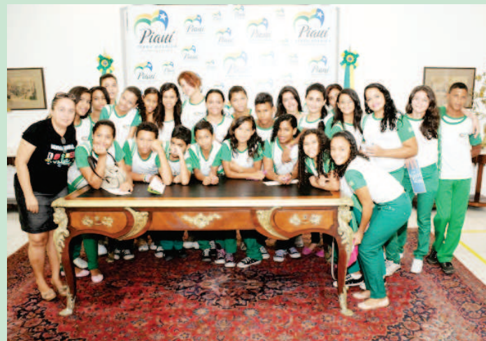
Os alunos não escondiam a sua alegria em prestigiar a exposição

A exposição Arte da Gente ficará aberta à visitação até o dia 31 de outubro, das 8h às 18h no palácio de Karnak.