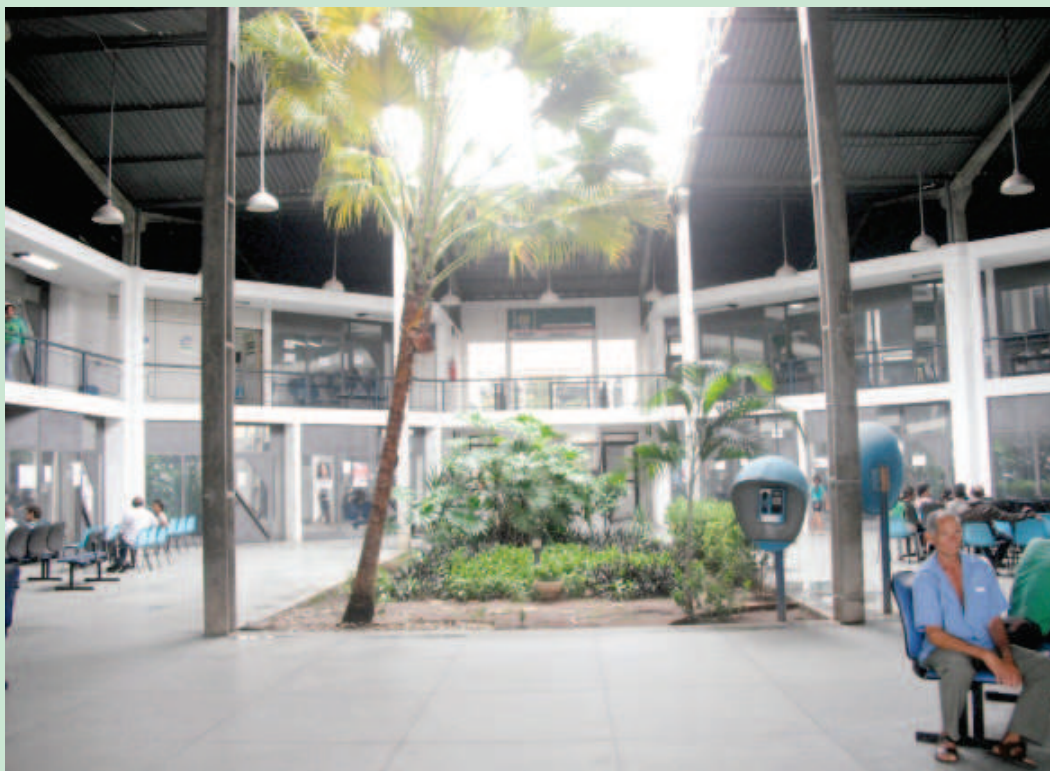
Defensoria Pública do Estado

Defensoria seleciona psicólogo para Núcleo de Defesa da Criança e do Adolescente.