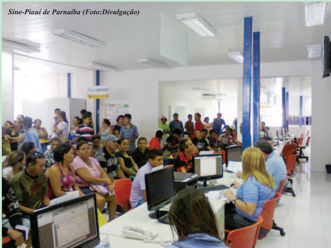
Sine-Piauí de Parnaíba

Para a secretária a iniciativa possui uma grande relevância para a implantação de melhorias no atual quadro dos Sines. “Acredito que um dos pontos mais importantes será o estabelecimento do co-financiamento de políticas públicas e a mudança dos instrumentos de pactuação, com eliminação da modalidade de convênio para repasse fundo a fundo ou transferência direta. Defendemos a criação do