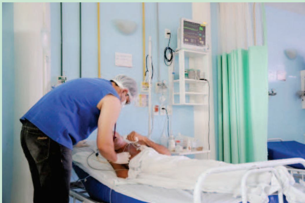
Hospital Regional de Piri-piri

O Hospital incentiva a participação dos profissionais através da entrega de um certificado com o somatório da carga de todas as atividades realizadas. E com a participação em todos os cursos ofertados, o funcionário ganha o bônus de uma folga. “Nós criamos políticas de incentivo para que os nossos profissionais participem e esse benefício seja sentido também pela comunidade”, ressalta a diretora do Hospital.