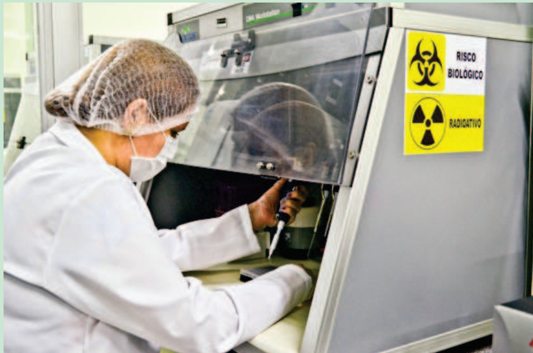
LACEN triplica número de exames de DNA