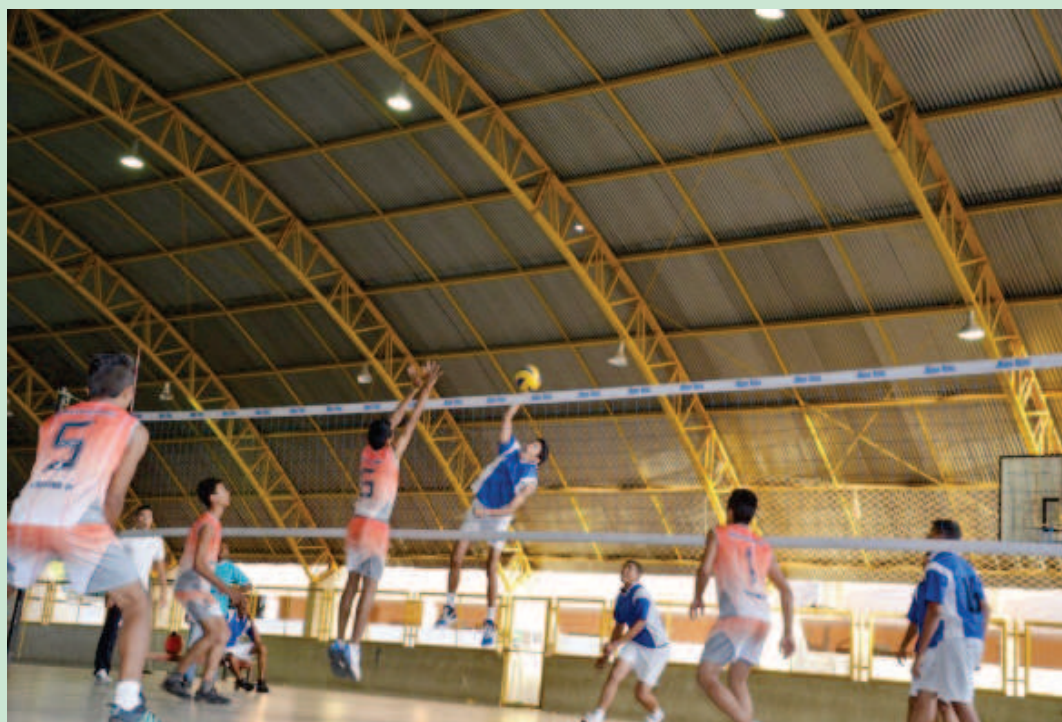
Jogos da Juventude conhecem classificados para segunda etapa