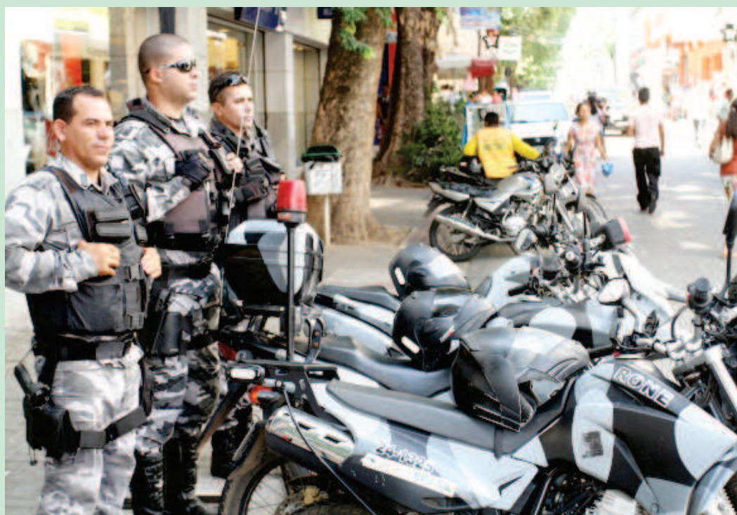
Policiamento no centro de Teresina

Para o comércio, o coronel da PM frisou que a aquisição de equipamentos de segurança é importante para garantir maior tranquilidade. “Tudo que o cidadão puder fazer para dificultar a ação de criminosos, deve ser feito”, alertou.