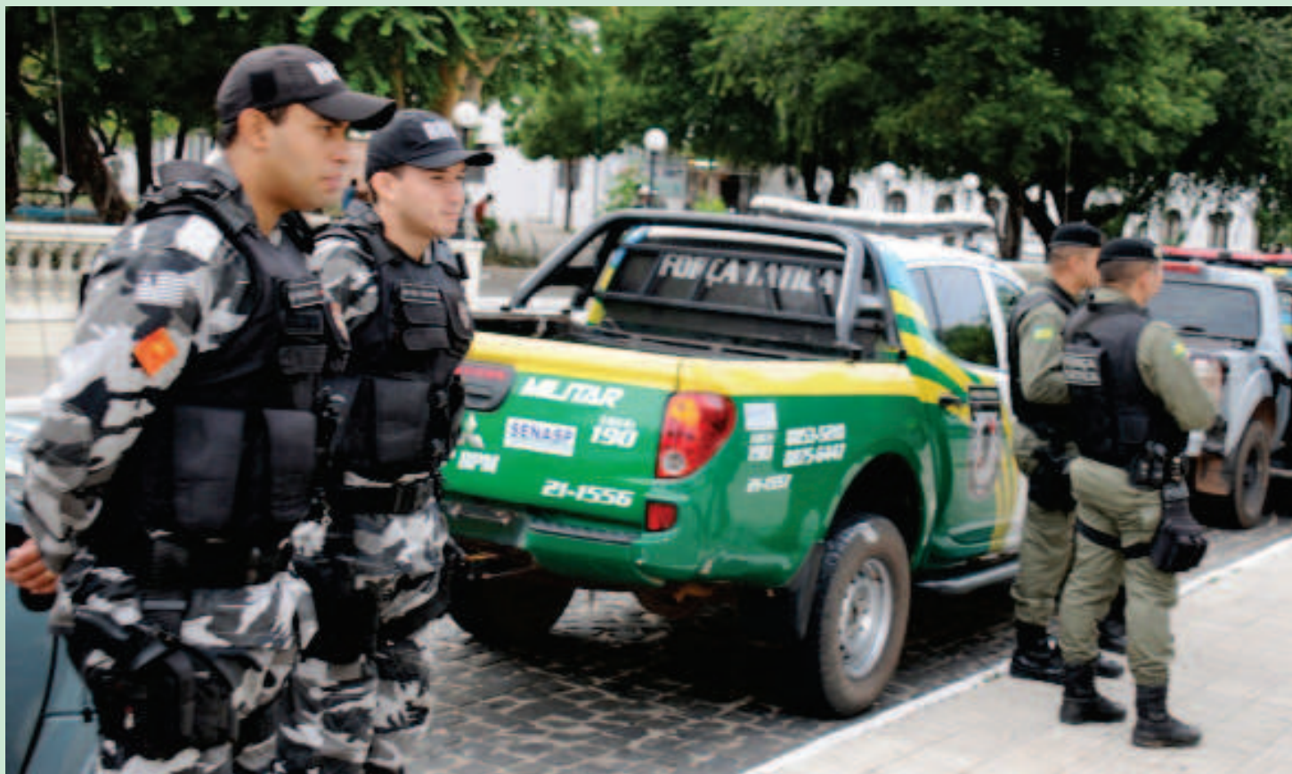
Cerca de 500 policiais militares estão nas ruas de Teresina

Operações visam coibir os furtos e roubos que costumam ocorrer nesta época do ano. Virgiane Passos