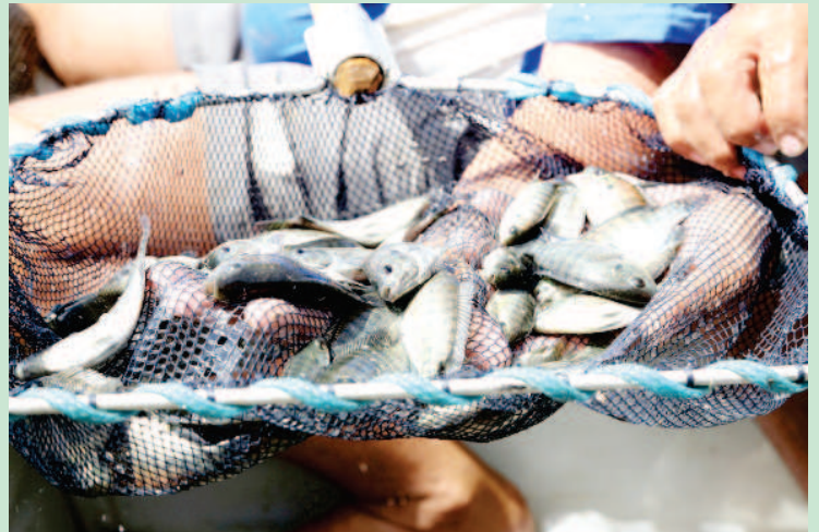
Peixes na barragem de Piaus, piscicultura em Pio IX

Segundo o chefe de departamento da Secretaria de Desenvolvimento Rural, até o mês de abril serão retirados cinco toneladas de peixes para a comercialização. “Estamos aguardando resultados promissores com o trabalho. Em abril, a expectativa é que tenhamos despescagem de cerca de cinco toneladas de peixe e, três