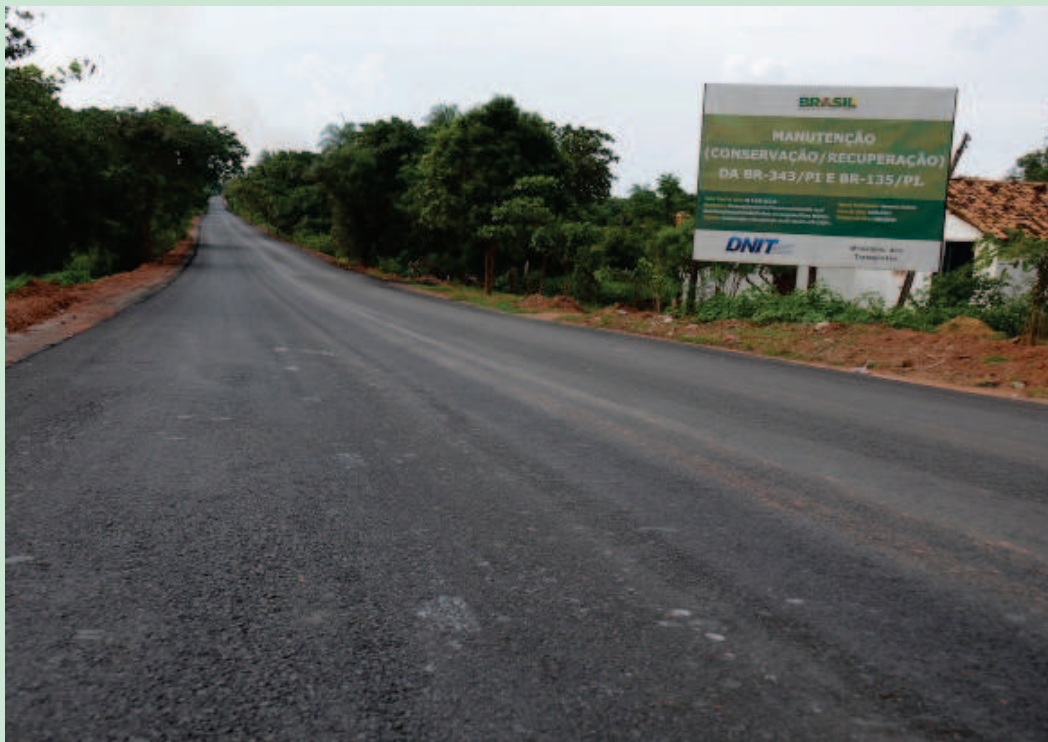
BR 135 - Trecho de Eliseu Martins a Manoel Emídio

Governo conclui trecho Bertolândia-Elizeu Martins _____ Francisco Leal