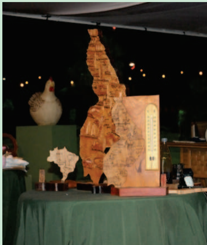
Em março, a Semana do Artesão será comemorada entre os dias 12 a 19

Em números, a Central arrecadou, em 2013, R$448.799,10, somando as vendas nas feiras, congressos, eventos e das lojas, expediu 125 novas carteiras de artesãos e renovou 126. O balanço do ano que passou foi extremamente positivo para nós, não só pelo valor arrecadado como também pela difusão do nosso trabalho pelo país. É extremamente gratificante ver um turista que visita nossos estandes se encantando com nosso artesanato, essa gratificação não se mede em reais.