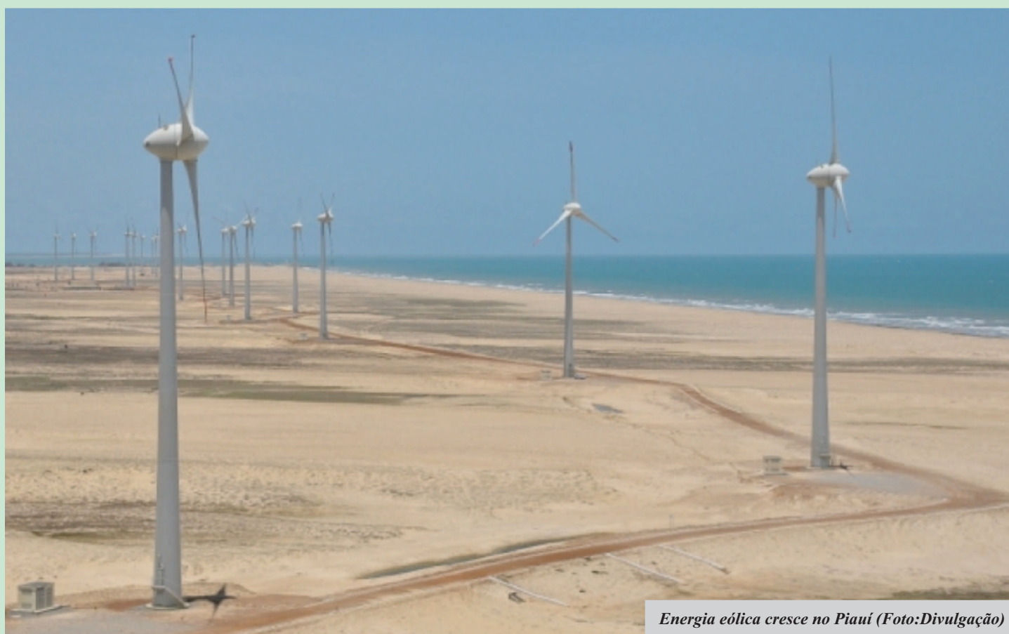
Energia eólica cresce no Piauí

O Piauí tem capacidade de produção de energia renovável que ultrapassa os 2.000 MW, que representa em 15 vezes a energia produzida pela Barragem da Boa Esperança e em mais do que o dobro da demanda energética do Estado. “São mais de R$ 7 bilhões em investimentos, somente com a implantação dos parques, que deve ocorrer até 2016, quando vamos deixar de importar para exportar energia”, afirma o secretário. Além da energia eólica, o Piauí também se destaca no potencial de energia solar.