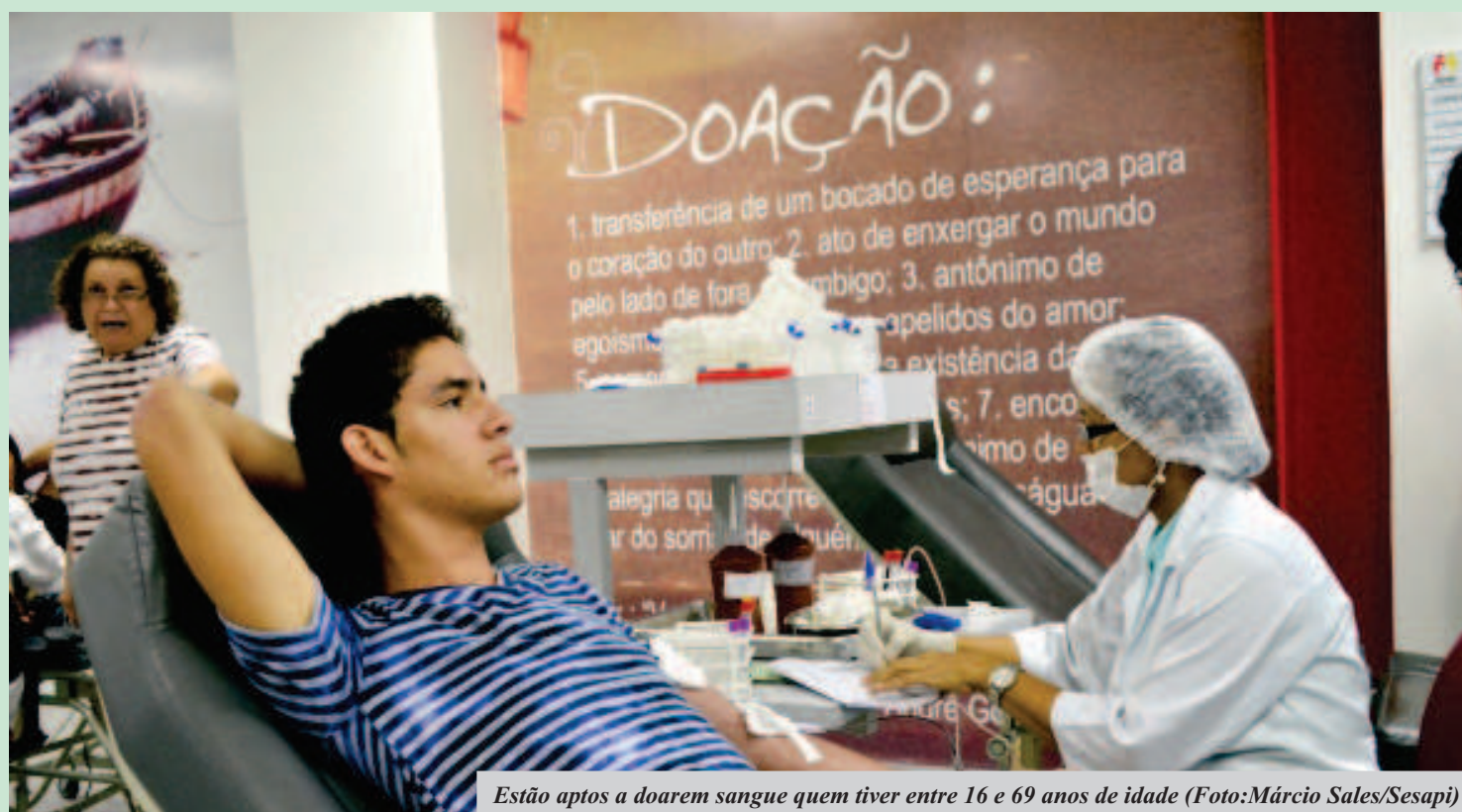
Estão aptos a doarem sangue quem tiver entre 16 e 69 anos de idade (Foto: Márcio Sales/Sesapi)

Vale ressaltar que quando o homem doa, dois meses depois, ele já pode doar novamente, quanto à mulher este intervalo de doação é de três meses. O Hemopi está localizado na rua Primeiro de Maio, 235, Centro-Sul de Teresina. O funcionamento é das 7h às 18h, de segunda-feira a sábado, inclusive, feriados.