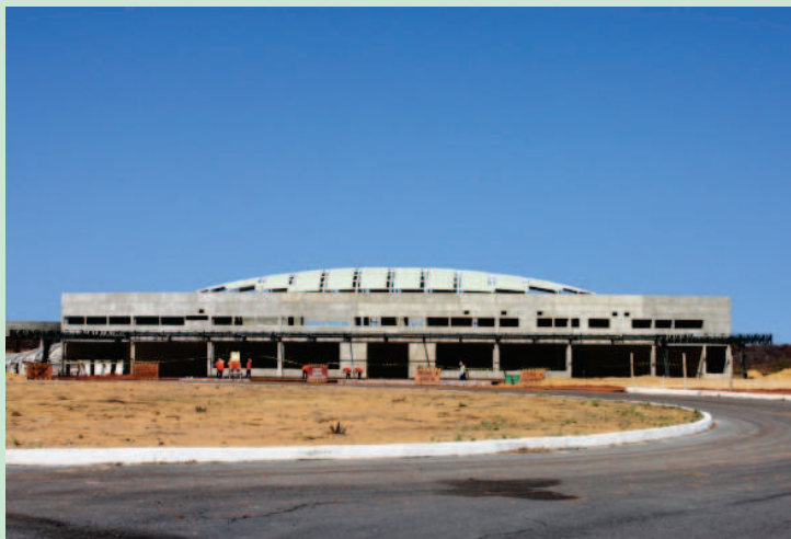
Aeroporto de São Raimundo Nonato