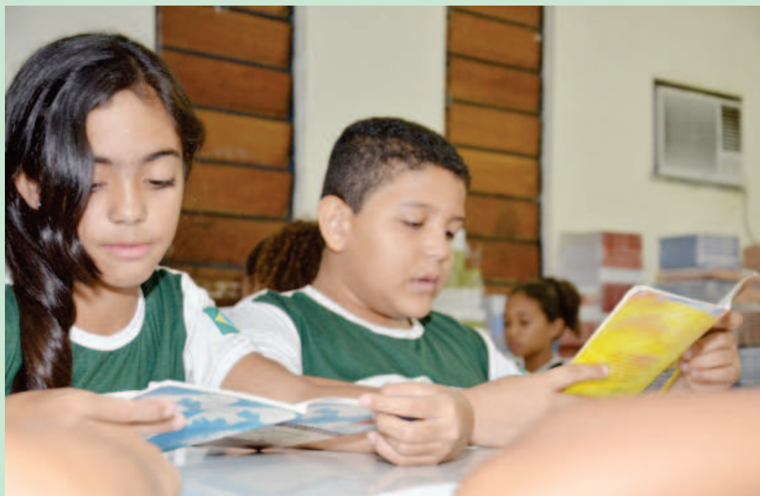
Escola de Tempo Integral

Em um dos mais tradicionais colégios de Teresina, o Liceu Piauiense, a reforma foi de emergência. Devido às fortes chuvas que caíram nos últimos dias, o colégio sofreu alguns problemas na cobertura, resultando em vazamentos e problemas nas instalações elétricas. “Estamos recuperando tudo isso em regime de emergência. Toda a instalação foi restaurada, troca de lâmpadas, tomadas e toda a parte de pintura também foi refeita. No Liceu foi uma ocorrência de imprevisto, mas trabalhamos muito para resolver todos os problemas”, explicou o diretor de Engenharia da Seduc.