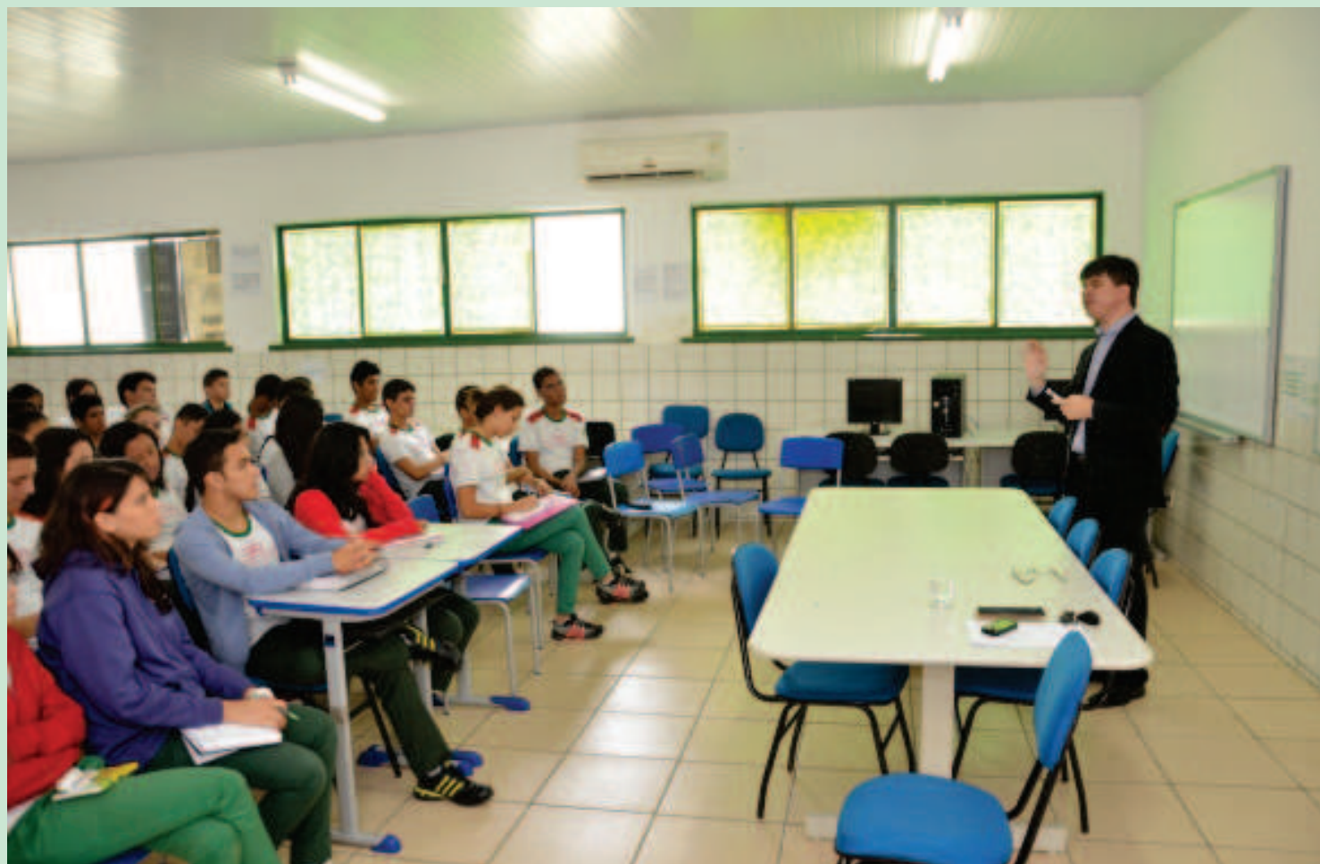
Alunos do Cemti recebem capacitação para o Parlamento Jovem Brasileiro