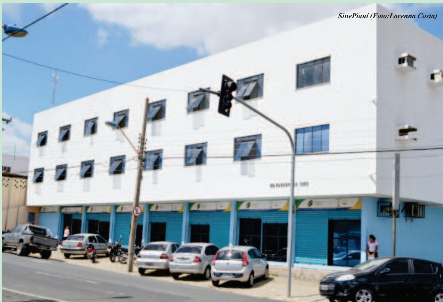
SinePiauí