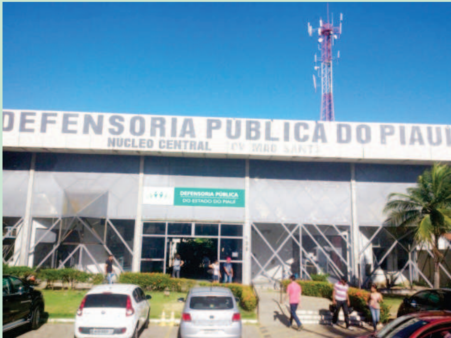
Defensoria Pública do Estado - DPE

Mutirão será realizado de 12 a 29 de maio de 2014, em parceria Tribunal de Justiça do Piauí (TJ-PI) e com apoio do CNJ