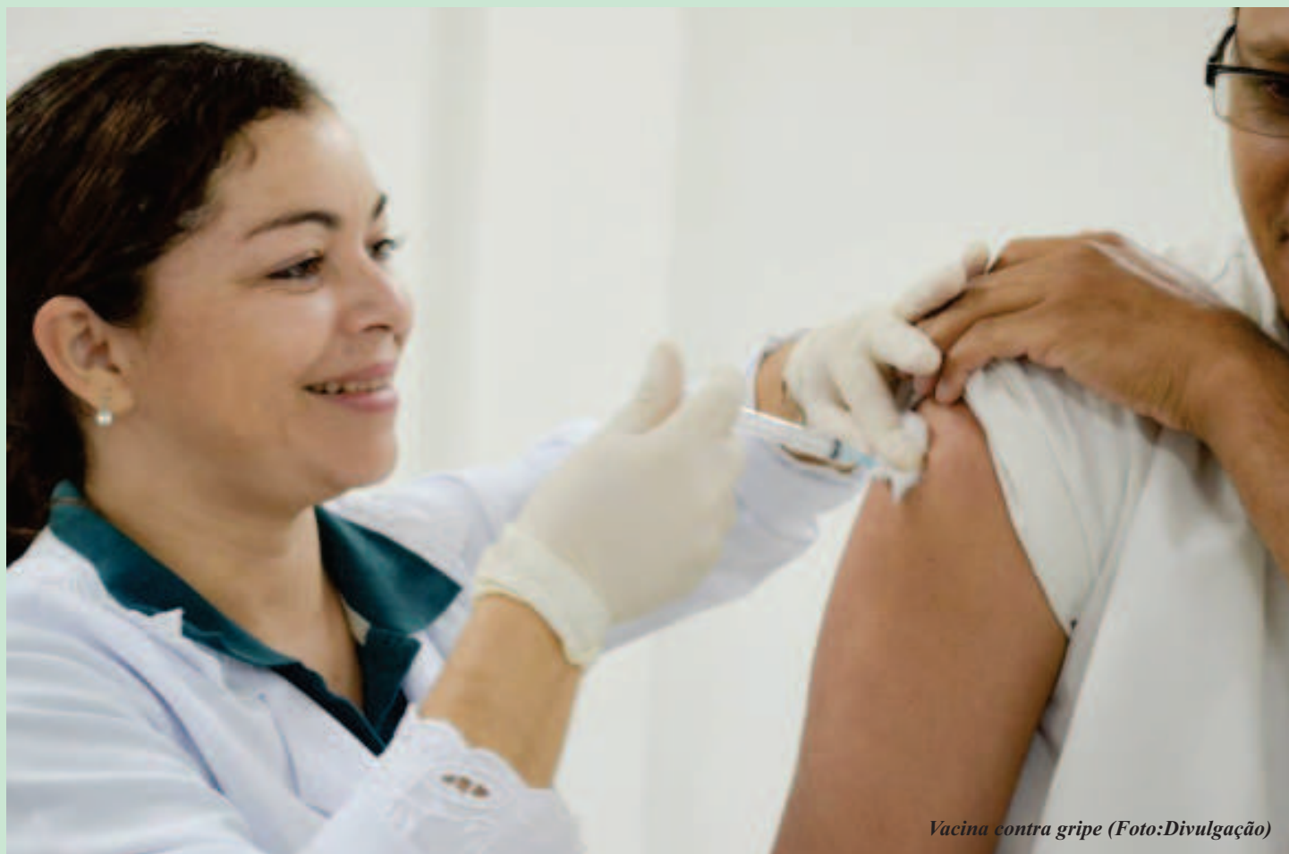
Vacina contra gripe

A Coordenação Estadual de Imunização da Secretaria de Estado da Saúde (Sesapi) retoma nesta terça-feira (22), a distribuição das vacinas contra a gripe para as demais cidades do Piauí. Em virtude do atraso na entrega no estado, por parte do Ministério da Saúde, somente o município de Teresina já está com suas doses disponíveis para o início da campanha nesta terça-feira.